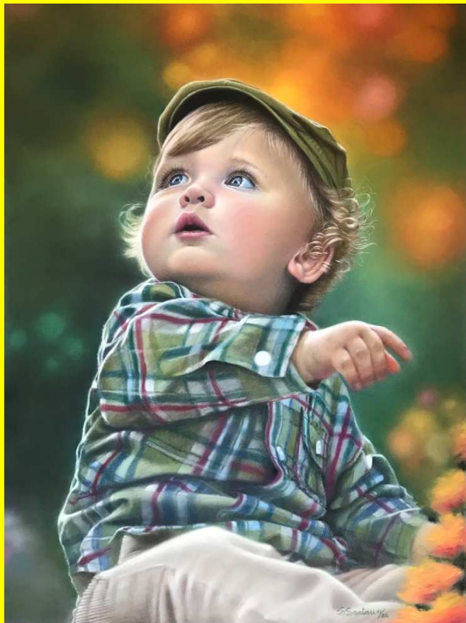
Stefania Santoni Innocente meraviglia , pastello secco su cartoncino