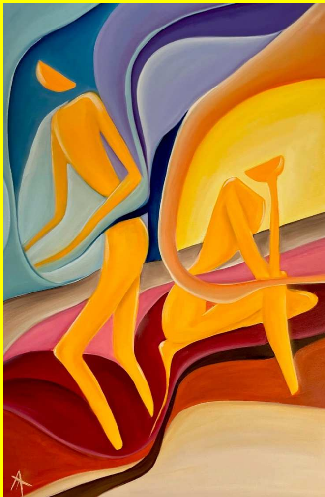
Algida Temil , Scisma , olio su tela, 70x100 cm